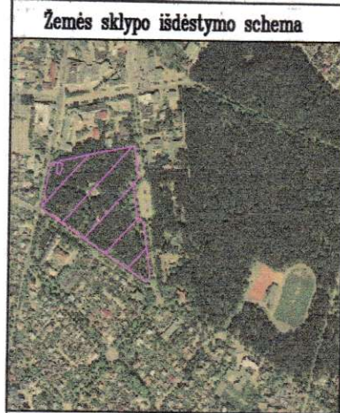
Žemės sklypo išdėstymo schema